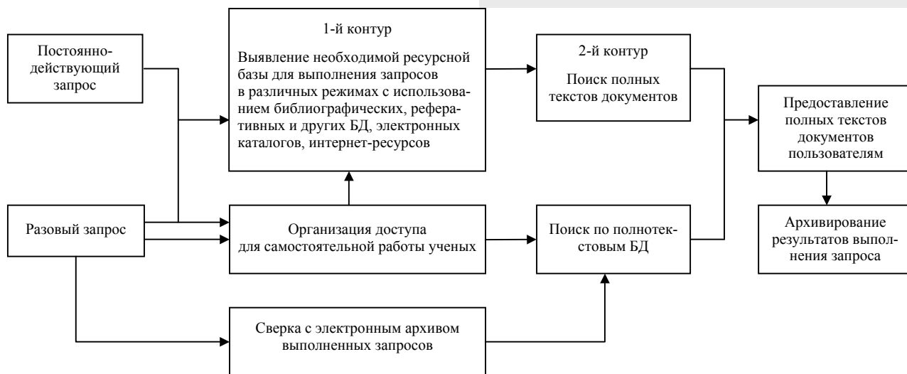
Рис. 3. Алгоритм использования полнотекстовых БД при СБО

3. Процентное соотношение использования полнотекстовых БД для научной работы распределяется по способу доступа следующим образом: удаленные – 91%, сетевые – 7%, собственной генерации – 2%. Библиотеки Централизованной библиотечной системы СО РАН приобретают или генерируют собственные БД. В данной статье рассмотрены только пять НИИ, но уже показательно, что в четырех из них накоплен некоторый полезный материал (см. табл. 2), который мог бы стать основой для распределенных БД. Одним из предложений по улучшению системы ИБО и СБО научных исследований является предоставление информации о наличии полнотекстовых БД собственной генерации в Библиотечно-методический совет ЦБС для использования в рамках информационной системы СО РАН.