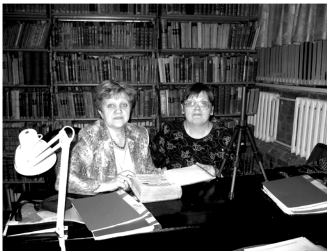
В отделе редких книг и рукописей ТПУ