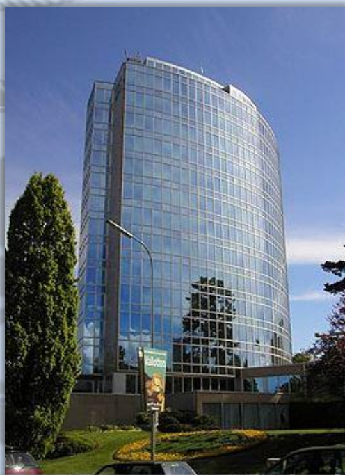
Международное бюро ВОИС

Всемирная организация интеллектуальной собственности (ВОИС) – это глобальный форум по вопросам выработки политики, оказания услуг, предоставления информации и сотрудничества в области интеллектуальной собственности.