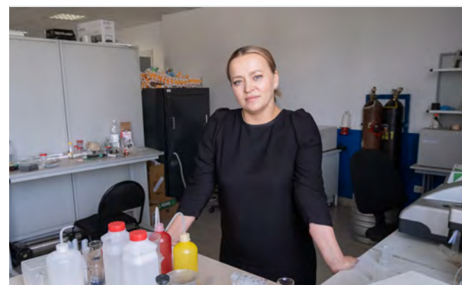
От идеи - до продукта