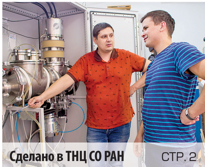
Сделано в ТНЦ СО РАН