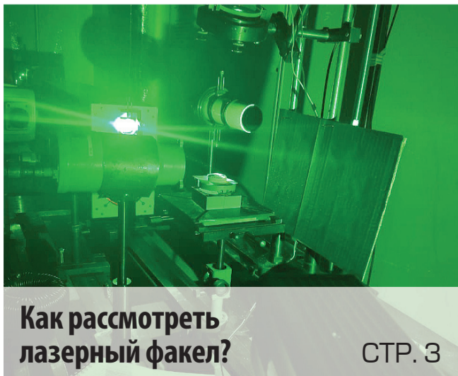
Как рассмотреть лазерный факел?