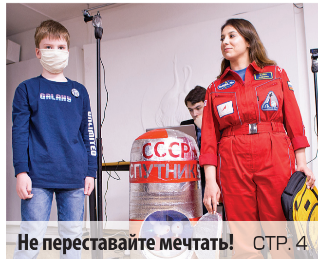
Не переставайте мечтать!